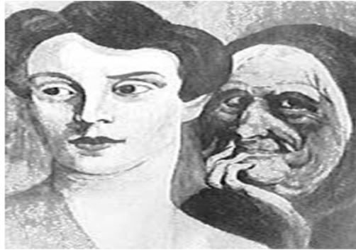
चित्र 2.2 – टीएटी में प्रयुक्त कार्ड

लिये उसे कुछ प्रश्न भी दिये जाते हैं जैसे – इस चित्र में क्या हो रहा है, इससे पहले क्या हुआ, इसके बाद क्या होगा, चित्र में प्रस्तुत विभिन्न पात्र क्या सोच रहे हैं, अनुभव कर रहे हैं आदि। इन प्रश्नों के उत्तर के आधार पर प्रयोज्य एक कहानी लिखता है। उत्तर के आधार पर प्रयोज्य के अभिप्रेरणा का मापन किया जा सकता है। प्रयोज्य में उपलब्धि अभिप्रेरणा है या शक्ति की अभिप्रेरणा है आदि। टीएटी कार्ड पर आधारित कहानी के मूल्यांकन के लिये विशेष अंकन पद्धति बनाई गई है। यह अंकन एक मानक प्रक्रिया के तहत किया जाता है। इसीलिये इस परीक्षण का उपयोग भी प्रशिक्षित व्यक्ति द्वारा ही किया जा सकता है। बच्चों के लिये इस परीक्षण का अनुकूलन भी किया गया है। यह परीक्षण चिल्ड्रन एपरसेप्शन परीक्षण (सीएटी) कहा जाता है।