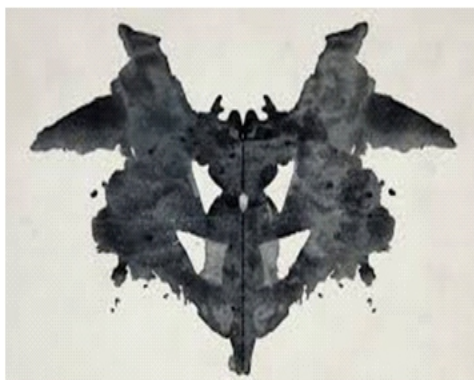
चित्र 2.1 रोशा स्याही धब्बा परीक्षण में प्रयुक्त एक कार्ड

यह परीक्षण हर्मन रोशा द्वारा विकसित किया गया। इसमें दस स्याही धब्बे जैसे चित्र वाले 10 कार्ड होते हैं। (देखें चित्र 2.1) प्रत्येक स्याही धब्बा 7 x 10 के आकार के कार्ड के ठीक बीच में मुद्रित होता है। प्रयोज्य इन स्याही धब्बों को देखकर यह बताता है कि वह इस कार्ड में क्या देखता है। प्रयोज्य की इन अनुक्रियाओं की व्याख्या/अंकन के लिये एक विस्तृत पद्धति भी तैयार की गई है। इस परीक्षण के उपयोग एवं परिणामों की व्याख्या के लिये कुशल प्रशिक्षण की आवश्यकता होती है।